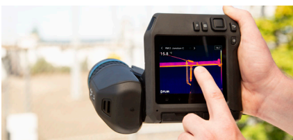
Evalúe equipamiento y evite fallos de componentes con seguridad y comodidad desde cualquier punto de vista